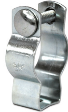
TABLA DE MEDIDAS